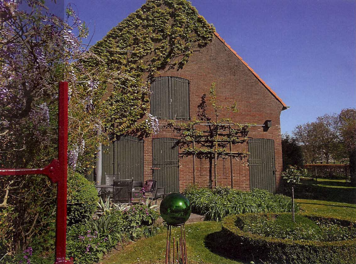
De voormalige koeienstal is omgebouwd tot groepslokaal om zo ook groepen te kunnen ontvangen.

De molen was altijd een plek van samen- komst.