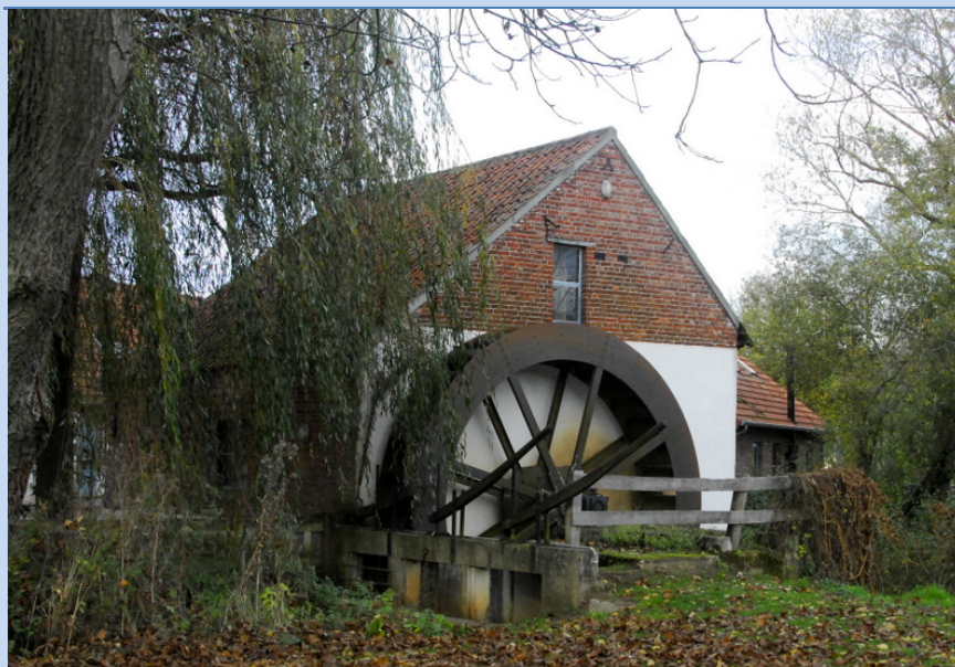
De Voorste Luysmolen vlak over de grens bij Altweerterheide.

Met zo'n waardering van een internationale vakjury die zo onder de indruk is van ons erfgoed, moeten we iets doen. De molens moeten we meer op de kaart zetten. Want het Weerterland en Kempens-Broek zijn uniek voor de natuur maar evenzeer voor het erfgoed waarbij de windmolens en watermolens een belangrijke rol spelen. Alleen is het gebied nog onbekend als molenland. In nauwe samenwerking met de molenaars en molenbeheerders willen we dat veranderen. We werken aan projecten om onze molens breed met Kempens~Broek op de kaart te zetten. U hoort hier in 2016 zeker meer over !