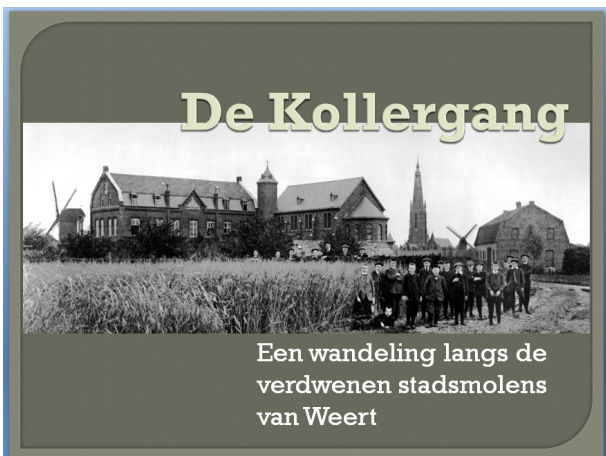
Een wandeling langs de verdwenen stadsmolens van Weert

Nieuw dit jaar is dat de molenstichting tussen de maanden oktober/november en maart/april, wanneer het programma op de molens grotendeels stil ligt, een programma met enkele lezingen gaat organiseren. Met deze lezingen willen wij de belangstelling voor molens en special natuurlijk voor de molens in Weert en het Weerterland vergroten. Zo hebben we een lezing over de verdwenen stadsmolens van Weert en een lezing over de molens van Weert. Daarnaast enkele leerzame films over molens, draaien en malen op de molens en over de diverse soorten molens. De lezingen kunnen door verenigingen, buurten, clubs geboekt worden maar het is de bedoeling ook enkele openbare avonden met een molenlezing te organiseren.